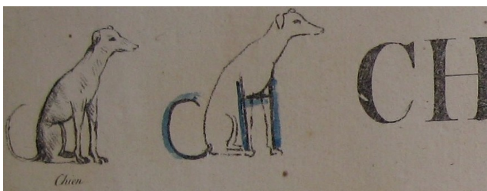
Un segundo ejemplo, correspondiente a la combinación de letras CH (ilustradas con la palabra chien (perro))

El autor hace dibujar cualquiera de estas figuras al alumno, y este, al aprender el nombre, que está representado en la letra inicial (como estos que se acaban de citar), aprende también la letra. Está claro que al dibujar la figura el alumno se ejercita en reconocer la forma de la letra, mientras el maestro, al hacerle pronunciar el nombre con el que va relacionada, le hace apartar, poco a poco, la inicial del resto de la palabra: A...GUILA, S....ERPIENTE, de manera que el alumno termina escuchando solamente el sonido de la vocal o el silbido de la consonante, y el resto de la palabra se reduce a ser un elemento de apoyo.