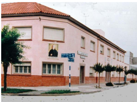
Una imagen del Instituto Próvolo