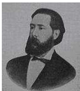
Médico doctor Eduardo Wilde (Ministro de Justicia e Instrucción Pública 1882-1886)

Dos años después, el 19 de setiembre de 1885, se aprobó la Ley Número 1.662.