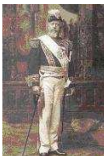
General Alejo Julio Argentino Roca (Presidente argentino 1880-1886)

En 1883, el ex Ministro de Educación Eduardo Wilde y el ex presidente argentino Julio Argentino Roca, mandaron al Congreso Nacional un proyecto de ley para construir un edificio nuevo para el Instituto de Sordomudos de la Capital.