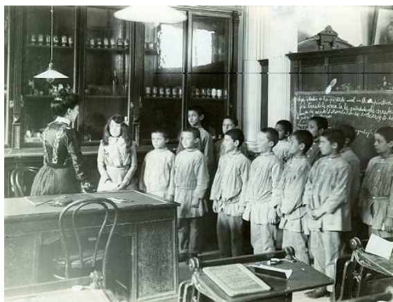
Alumnos del Instituto Nacional de Sordomudos