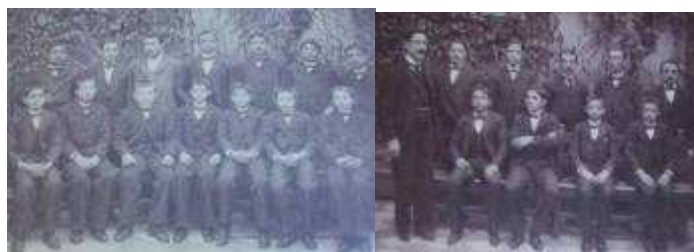
Alumnos del Instituto Nacional de Sordomudos

El instituto era solamente para varones sordos.