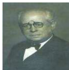
Asociación de Sordomudos de Ayuda Mutua Primer asociación de sordos creada el 30 de junio de 1912 en Buenos Aires Argentina