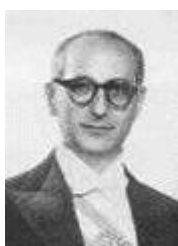
Arturo Frondizi (1958-1962)

En 1958, el presidente argentino era el doctor Arturo Frondizi.