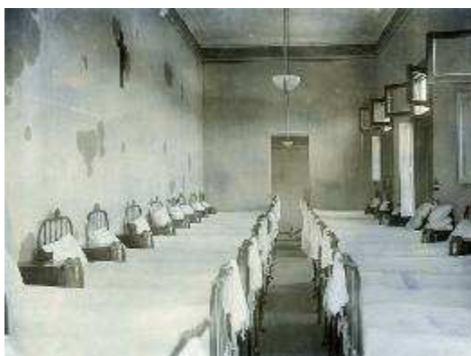
Instituto Nacional de Sordomudos - Capital Federal - Buenos Aires Argentina

Los niños sordos de las provincias argentinas dormían en las escuelas. En los recreos y en las noches, se comunicaban con las manos.