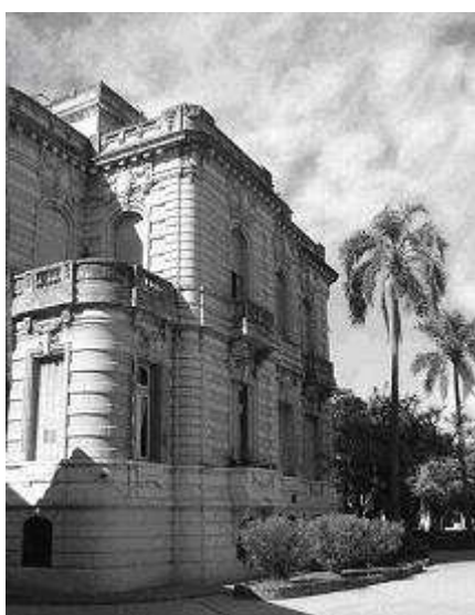
Instituto Nacional de Sordomudos, 1885. Aparentemente este edificio fue ocupado en 1938. Ahora se llama Escuela de Educación Especial Número 28 Doctor Bartolomé Ayrolo: calle Defensa 1170 Villa Devoto Ciudad de Buenos Aires.

El Instituto Nacional de Sordomudos fue la primera escuela oficialmente oralista de la Argentina.